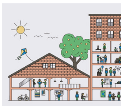
Ideen für das Areal Zeughaus-West

Uster ist ein attraktiver und begehrter Wohnort. Um die wachsende Stadt geordnet zu entwickeln, muss die Ortsplanung aktualisiert werden. Es braucht Regeln für die Verdichtung der bestehenden Baugebiete.