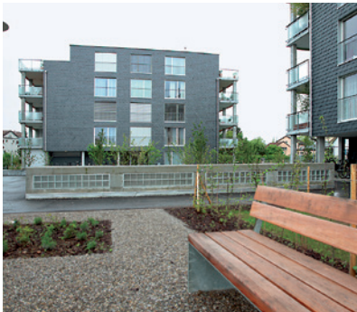
Vier Genossenschaften an der Brandstrasse