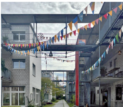
Zwei Genossenschaften Im Werk