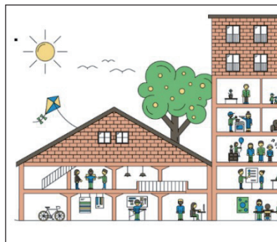
Ideen für das Areal Zeughaus-West

Uster ist eine attraktive Stadt und beliebter Wohnort. Um die wachsende Stadt geordnet zu entwickeln, muss die Stadtplanung aktualisiert werden. Es braucht eine Verdichtung der bestehenden Baugebiete mittels Aufzünungen.