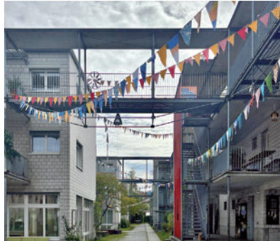
Zwei Genossenschaften Im Werk